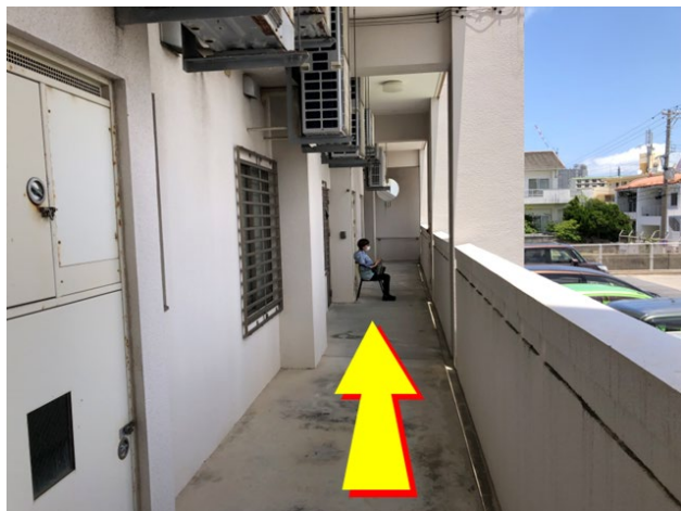
①奥までお進み下さい