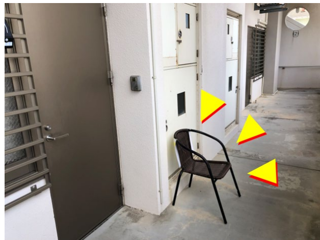
②イスにかけてお待ち下さい